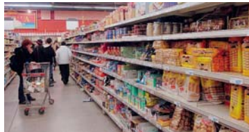
Marca commerciale Maggiori vendite nel petcare e nel fresco.