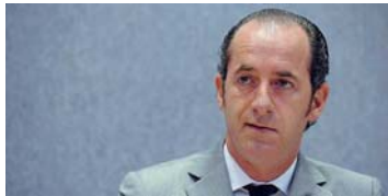
Quote latte ieri il ministro ha fornito alcune anticipazioni.

Novità in vista poi anche per quanto riguarda l'etichettatura obbligatoria di provenienza che, come ha detto il ministro, entro una settimana dovrebbe essere applicata per l'olio extra vergine di oliva. Si tratta di una misura fortemente attesa dai produttori vessati dalla concorrenza di paesi come Grecia, Turchia, Spagna.