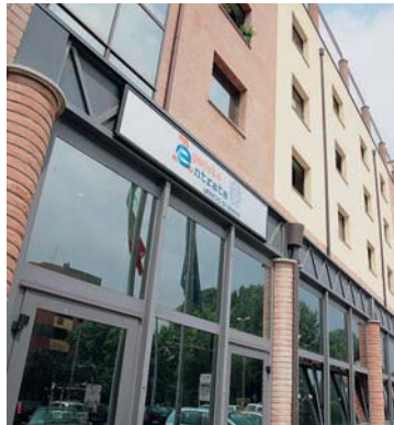
Agenzie fiscali La sede delle Entrate in Strada Quarta.

«Con questo ultimo passaggio la procedura si è definitivamente chiusa - spiega in una nota il ministro per la Pubblica Amministrazione e l'Innovazione - e i contratti, che riguardano più di un milione e 300 mila dipendenti, entrano pertanto in vigore a tutti gli effetti». Il via libera del Cdm e la certificazione successiva è stata accolta con favore dalla Cisl e dalla Uil, mentre la Cgil, che non ha siglato le intese lo scorso novembre, mantiene la propria contrarietà a questa soluzione, perché l'incremento salariale deciso è troppo basso rispetto all'inflazione attuale.