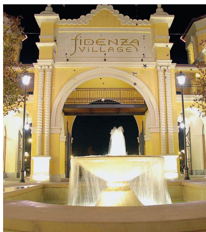
Fidenza Village Più che raddoppiate le presenze a inizio gennaio.

2009 di saldi a Fidenza Village hanno visto più che raddoppiare sia le presenze che il fatturato rispetto allo stesso periodo dell'anno scorso.