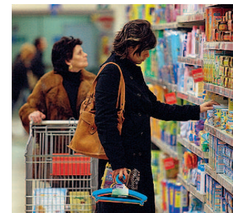
Accordo «Spendere meno»

Per i prodotti da forno, in una settimana al mese i panificatori