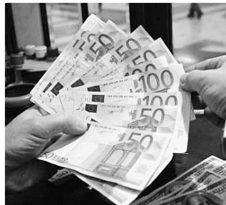
Nuovi dati D&amp;B sui pagamenti

In tempi di crisi i tempi di pagamento delle fatture si allungano. Due settimane di ritardo nei casi migliori, oltre 20 giorni in quelli peggiori, in Emilia-Romagna. Le imprese di Parma in E/R sono le più virtuose secondo le Dun&Bradstreet e del Sole 24 Ore.