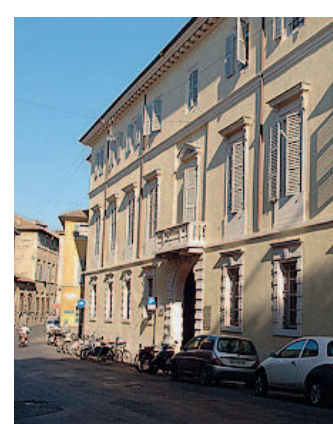
Palazzo Soragna Sede dell'Upi.

Nel corso della «lezione» verranno esaminate anche le più recenti novità in tema di tassazione dei redditi di lavoro dipendente, sia quelle già in vigore (ad esempio le modifiche in materia di assistenza fiscale riguardanti, in particolare, la tempistica dei relativi conguagli) sia quelle di prossima applicazione, tra le quali ricordiamo l'obbligo di in-