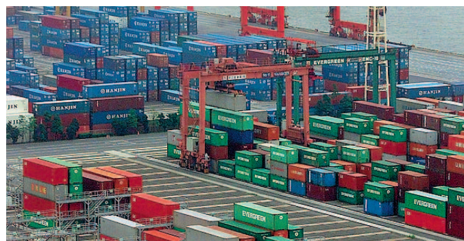
Internazionalizzazione Otto seminari per informare le aziende.

■ Mercati esteri, quali opportunità di business. L'Unione parmense degli industriali, in collaborazione con il Gruppo imprese artigiane e il Cisita, organizza, da ottobre a marzo, un ciclo di seminari dedicato alle «Nuove strategie per l'internazionalizzazione delle imprese».