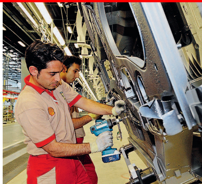
Imprese Con la «manovra d'estate» agevolazioni più limitate.

presa, indipendentemente dalla loro forma giuridica e dal tipo di contabilità adottata». E che oggetto dell'agevolazione «sono le spese in macchinari e apparecchiature che intervengono meccanicamente o termicamente sui materiali o sui processi di lavorazione (compressori, macchine utensili, gru, motori, turbine)». L'incentivo denominato «Detassazione degli utili reinvestiti in macchinari», è applicabile a partire dal periodo d'imposta 2010, di fatto, quindi, l'intervento avrà rilevanza nel modello Unico 2011. Una importante novità è