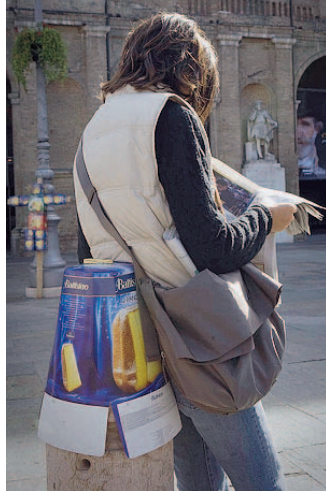
Battistero Campagna a metà.

Si tratta di un atto formale che precede la firma del contratto definitivo, attesa per martedì, che porterà la Battistero a ricevere nuova liquidità, oltre a li-