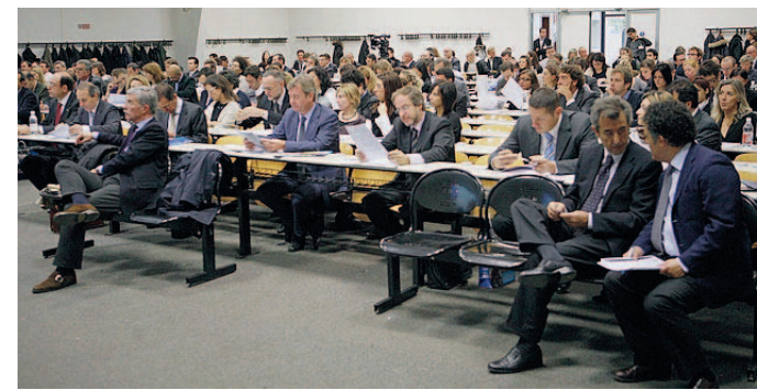
Economia Il folto pubblico presente al convegno.

Lugli si è soffermato in particolare sulla cosiddetta «conoscenza interna» e sul miglioramento delle previsioni di vendita. «In una parola si induce a competere e rivelare informazioni sulle vendite future e così si tramuta la conoscenza in guadagni riducendo inoltre i costi di gestione delle scorte, aspetto non secondario vista la crisi mondiale». Un sistema già operativo in realtà come Microsoft, Siemens e Google, dove la previsione collettiva, il «prediction market», risulta più affidabile di quella di qualunque esperto in materia, ar-