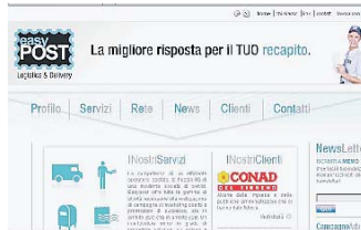
Il servizio Easypost

Easy post è una nuova iniziativa imprenditoriale promossa nell'ambito delle attività di recapito e micrologistica integrata, con particolare riferimento ai settori finanziario, GDO/largo consumo, immobiliare e della Pubblica Amministrazione. Un moderno servizio di stoccaggio, pick&pack e fulfillment di stampati ed articoli promozionali ci consente infatti di soddisfare ogni esigenza di approvvigionamento di reti distributive complesse con serietà e competenza.