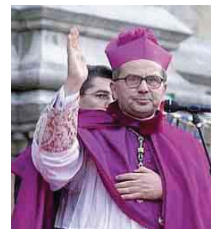
Il Card. Caffarra

esistenza in questi difficili anni: dalla tecnologia alla politica, dall'economia all'ambiente, dalla genetica alla povertà e al sottosviluppo. La lettera papale colma il "vuoto" valoriale ereditato dal Novecento e ricorda che è responsabilità degli uomini orientare lo sviluppo materiale in una direzione coerente con lo sviluppo etico. Un messaggio "universale" di grande attualità di cui ciascuno può farsi portatore.