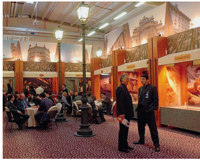
Parmacotto Cresce l'attività di promozione sui mercati esteri.

Il know how di Crédit Agricole e l'importante relazione di partnership sviluppata con Sace,