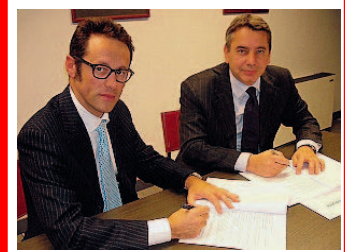
Firma Guiotto e Guardalben.