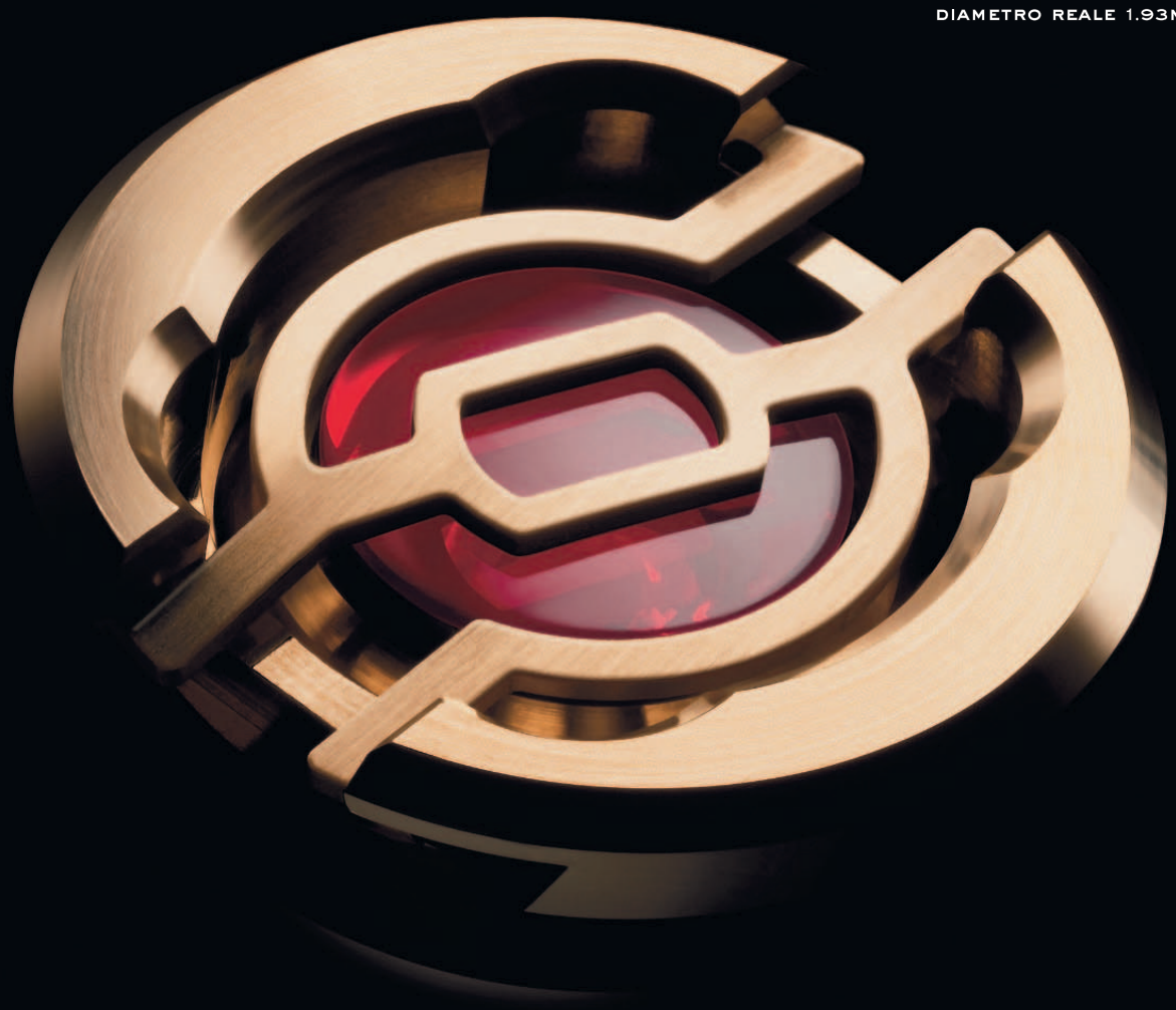
DIAMETRO REALE 1.93MM