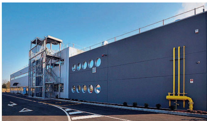
Servizi Italia Il sito di Treviso. Nuovi contratti anche in Veneto.

Per quanto riguarda la gara indetta dalla Regione Piemonte e Azienda sanitaria locale di Alessandria, l'importo complessivo della commessa per Servizi Italia è di circa 15,9 milioni di euro per l'intero periodo contrattuale che prevede una durata di 4 anni con ulteriori 12 mesi di proroga. In particolare, Servizi Italia curerà per l'ente l'erogazione dei servizi di lavano della biancheria, per Azienda sanita-