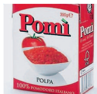
Pomì in Tetra Recart.

La confezione è leggera, facile da aprire e da stoccare, sicura perché non ha angoli taglienti ed è facilmente richiudibile, per conservare il prodotto, garantendo la freschezza ad ogni aper-