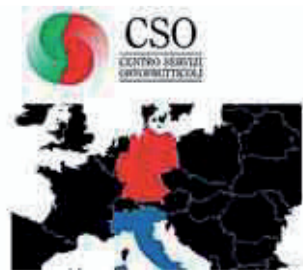
Il portale www.csoservizi.com

Il CSO di Ferrara realizza annualmente uno studio sull'andamento degli scambi commerciali di ortofrutta tra Italia e Germania. Le esportazioni italiane di ortofrutta dal 2000 al 2008 si sono attestate mediamente su oltre 3,3 milioni di tonnellate. La Germania assorbe in media il 37% dell'export italiano ma analizzando l'andamento dell'export si evidenzia un forte calo delle quote