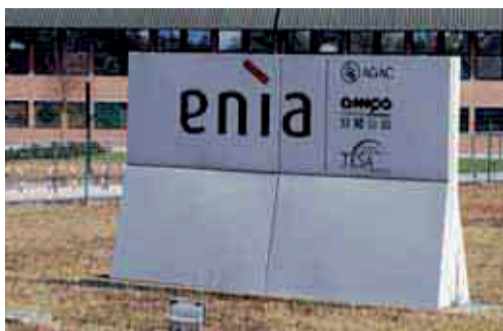
La sede di Enìa

HERA resta alla finestra I tempi stretti complicano le scelte di Enìa