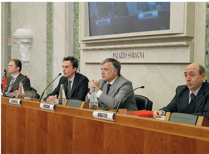
Palazzo Soragna Ieri il convegno di Upi, Gia e dottori commercialisti.

Ecco quindi che per informare sulla corretta compilazione del documento e sulle operazioni che invece non vanno assolutamente effettuate, si è svolto a Palazzo Soragna un convegno