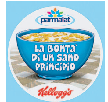
Parmalat Campagna con Kellogg.

Fava: «La sinergia lega aziende internazionali entrambe fortemente radicate in Italia»