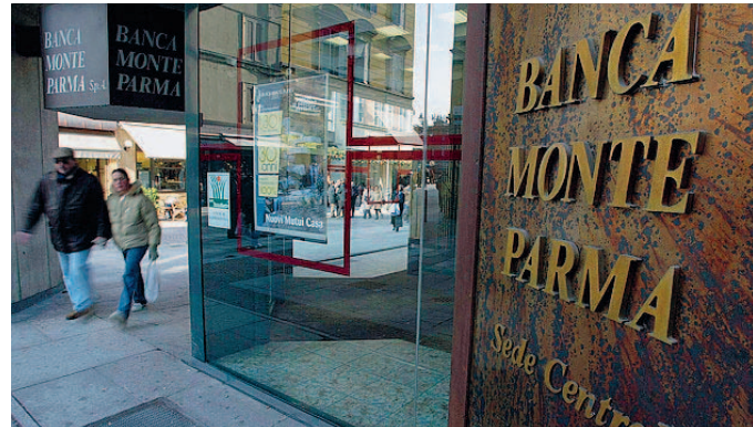
Banca Monte il «caso» è stato discusso ieri in Provincia.