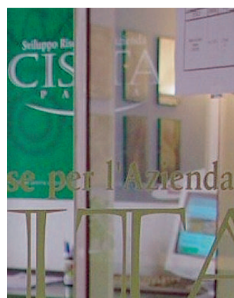
Cista Al via un nuovo corso.

Nel processo di riorganizzazione dell'azienda, tipico degli ultimi anni, i confini dell'impresa sono stati ridisegnati e le responsabilità delle diverse funzioni si sono diversificate. In questa nuova ottica, le attività di controllo di gestione e della finanza aziendale rimangono una priorità organizzativa primaria per tutte le tipologie d'impresa e assumono un ruolo sempre più strategico per la vita dell'azienda e per lo sviluppo del business. In questo quadro Cista Parma offre la possibilità a chi non ha mai maturato espe-