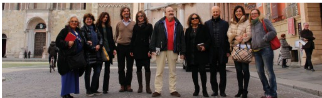
Progetto I partecipanti alla presentazione di «Parma Centro, il Cuore del Ducato-Musica nei Borghi».

«Parma Centro, il Cuore del Ducato-Musica nei Borghi» è l'inno-