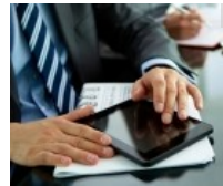
Fare Trading Online