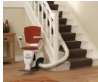
Prezzi del montascale?