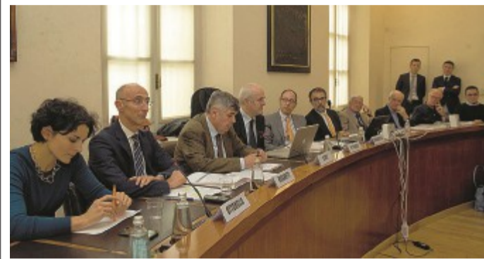
Palazzo Soragna Un momento dell'incontro.